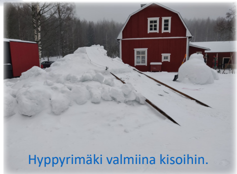
Hyppyrinä valmiina kisoihin.

Puijon Latu oli mukana Kansallisena hiihtopäivänä Konttilan Elämystilalla.