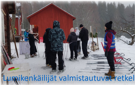
Lumikenkäilijät valmistautuvat retkelle.