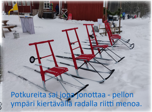
Potkureita sai jopa jonottaa - pellon ympäri kiertävällä radalla riitti menoa.