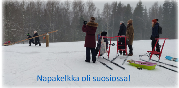
Napakelkka oli suosiossa!