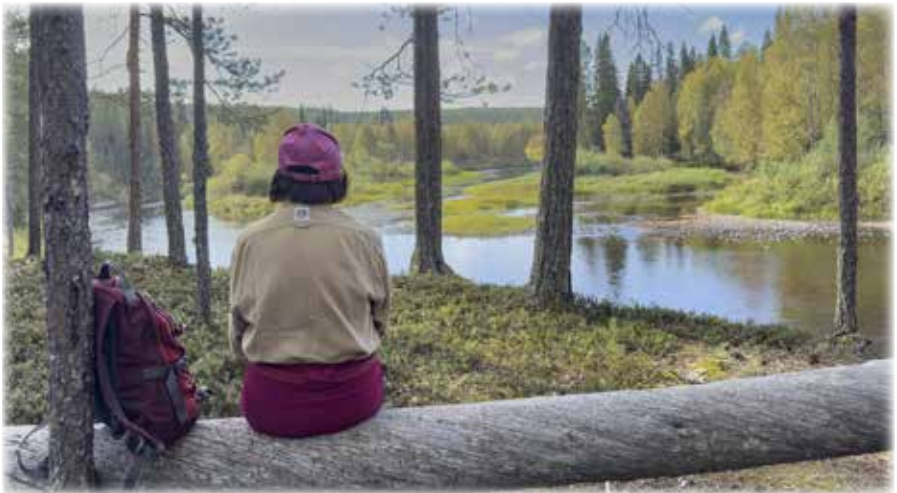
Kuusinkijoki, Kuusamo.