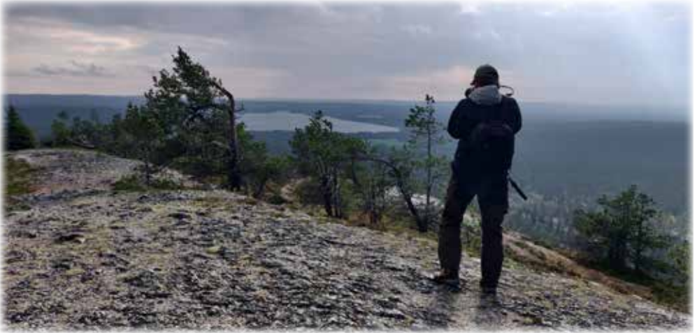
Rukan Juhannuskalliolla.