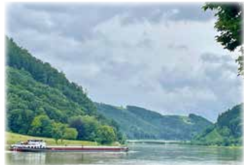
Teksti Hilka Lassila