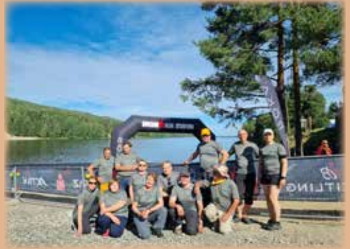
Puijon Latu, Siilin Latu ja Tahko Ironman.