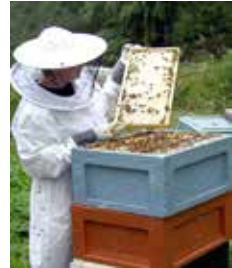
3. Mehiläiset saapuivat Pilppaan.