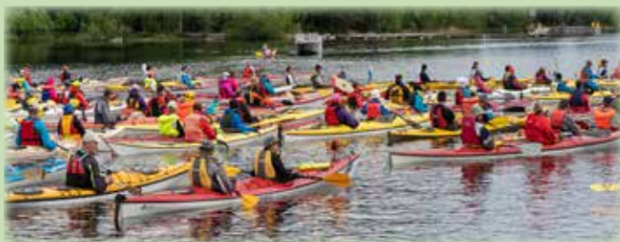
Suomi meloo 2018 starttasi Rauhalahdesta.