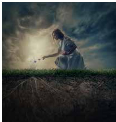
Kuvassa Lotta Vaattovaara.

http://kuopionkaupunginteatteri.fi/aidinmaa-9700