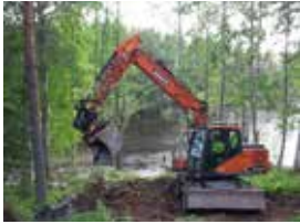
1. Laavun pohjatyötä.