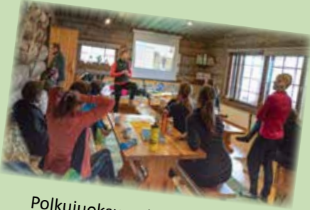
Polkujuoksun ohjaajakoulutus pidettiin Pilpassa.