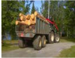
2. Hirret saapuvat.