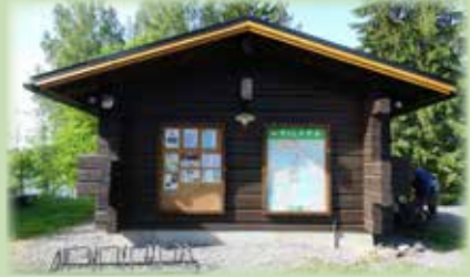
Uudet ilmoitustaulut Kihhauksen seinällä.