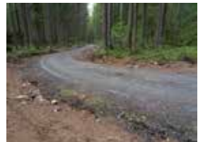
7. Tien reunat on kunnostettu.