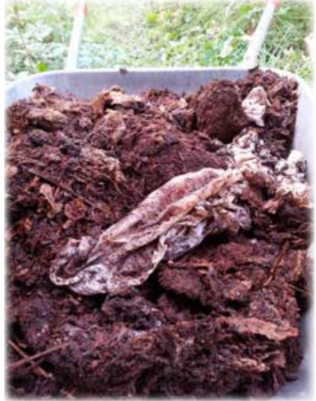
Runo ja kuva: Martti Rissanen

Noudatamme Pilpan alueella roskattoman retkeilyn periaatetta. Tulisijassa voit polttaa puhtaat pahvi- ja paperipakkaukset. Muun jätteen otat mukaan ja lajittelet kierrätykseen ja sekajätteeseen kotona.