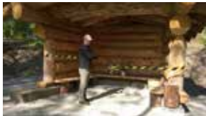
5. Jari Kyllönen vihki laavun.