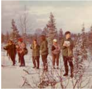
Puijonlatulaisia Totovaaran reissulla 1974