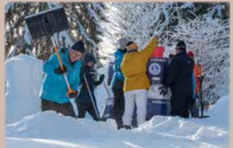
Lumiukkoaihioita syntyy porukalla.