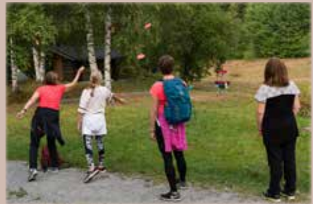
Frisbee kiinnosti Unelmien liikuntapäivänä niin aikuisia kuin lapsia.