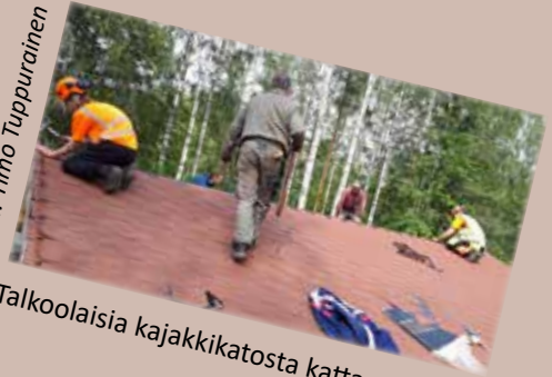
Talkoolaisia kajakkikatosta kattamassa.