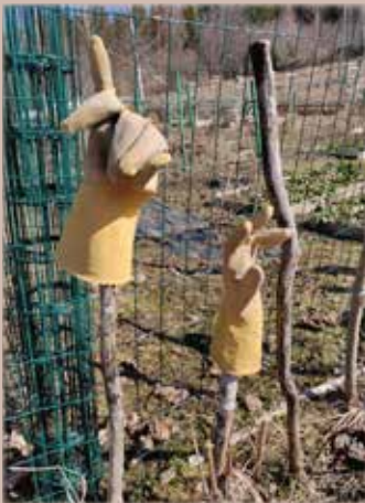
Viljelijän hanskat valmiina.