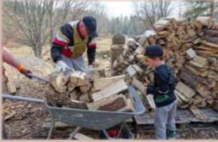
Isän kanssa talkoissa.