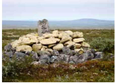
VEDENJAKAJAN TUOLLE PUOLELLE

Tanska-Norjan ja Ruotsi-Suomen välinen rajapyykki no 337 vuodelta 1765 sijaitsi Ravdoavin laella Pöyrisjärven erämaassa.