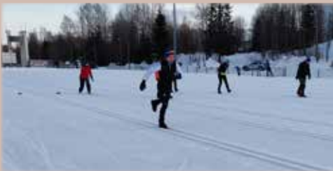
Hiihtotekniikkaa yhdellä suksella.