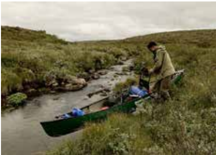
Maaderjoki kuivaa ja vetotaival alkaa.

puolelle. Ahkkanasjoen latvapurot tulivat vastaan parin kilometrin jälkeen. Vähitellen pajukkoinen puro muuttui kiviseksi koskeksi ja lopulta vetäväksi virraksi, joka kuljetti matkalaisia välillä hyvinkin vauhdikkaasti kohti Karasjoen kylää. Retkelle mahtui monenlaista matkantekoa. Melottiin yli järvien, lompoloiden ja tyyneiden suvantojen. Laskettiin vilistäviä virtoja ja koskia. Kiskottiin kanoottia ja tavaroita pitkin jäkäläkankaita ja vetisiä soita. Välillä piti kahlata kivisessä koskessa kanoottia taluttaen tai köydellä ohjastaen. Ja tietysti taukopäivinä tutkittiin ympäröivää viddaa jalkapatikassa. Se oli todellista yhdistelmäretkeilyä - kuten joku on keksinyt uuden termin - hybridivaellusta. Raskasta se oli, mutta hauskaa, suosittelen.