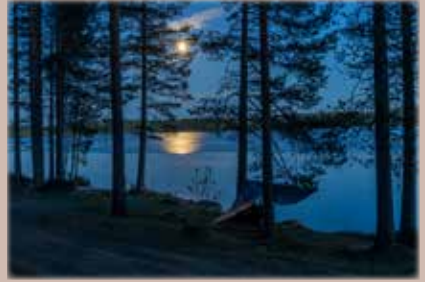
Ihanteellinen majoite täyden kuun aikaan.