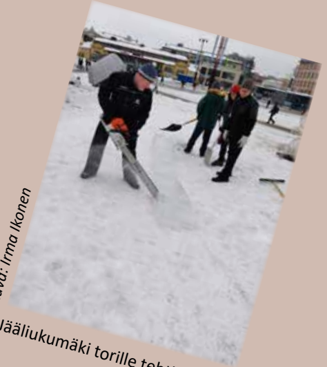
Jääliukumäki torille tehtiin yhteisvoimin.