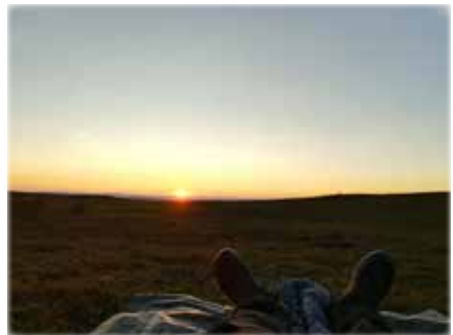
Kurssin viimeinen yö tunturissa.

P.S. Ai niin, Mitkä ihmeen Tervapirut?? Se selviää seuraavilla järjestämilläni retkillä.