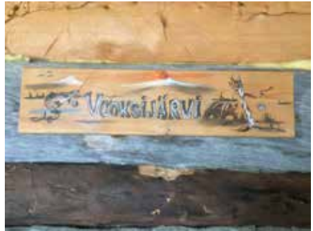
Nimikyltti kämpän seinällä