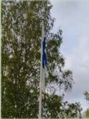
Suomen luonnon päivänä liputetaan.