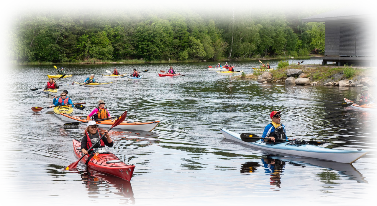
Kuva 5. Puijon Ladun Suomi Meloo -viestin avausosuuden melojat saapuvat Paavon johdolla Rauhalahteen.

Melontavuosi 2018 oli vilkas sekä avovesillä että uimahallissa, ja tuoreet melontaohjaajat kerryttivät osaamistaan ahkerasti. Pitkä ja aurinkoinen kesä suosi melontatapahtumia, ja tapahtumiimme osallistuneiden määrä nousi edellisestä vuodesta lähes 50 %. Koko yhdistyksen kalusto oli käytössä useassa tapahtumassa.