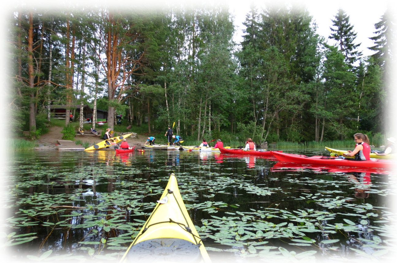
Kuva 6. Puijon Ladun ”keskiviikkomelajat” palaavat kotirantaan. (Kuva: Sakari Paimio).

*Suorituskerta tarkoittaa yhtä henkilöä melontatapahtumassa. Monipäiväisessä tapahtumassa suorituksia on laskettu yksi suoritus/hlö/vrk.