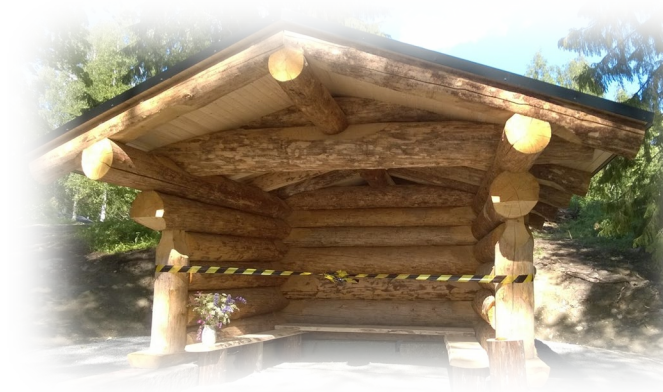
Kuva 4. Pilpan uusi hirsinen laavu sai nimen Lehmus.

Uusi laavu nimettiin jäseniltä tulleiden nimiehdotusten perusteella: samalla vanha, lähinnä Pilpan majaa oleva laavu, sai nimen "Koivu". Nimiehdotusten lähettäjä oli saanut idean ehdotukseensa laavujen kupeilla kasvavista puulajeista.